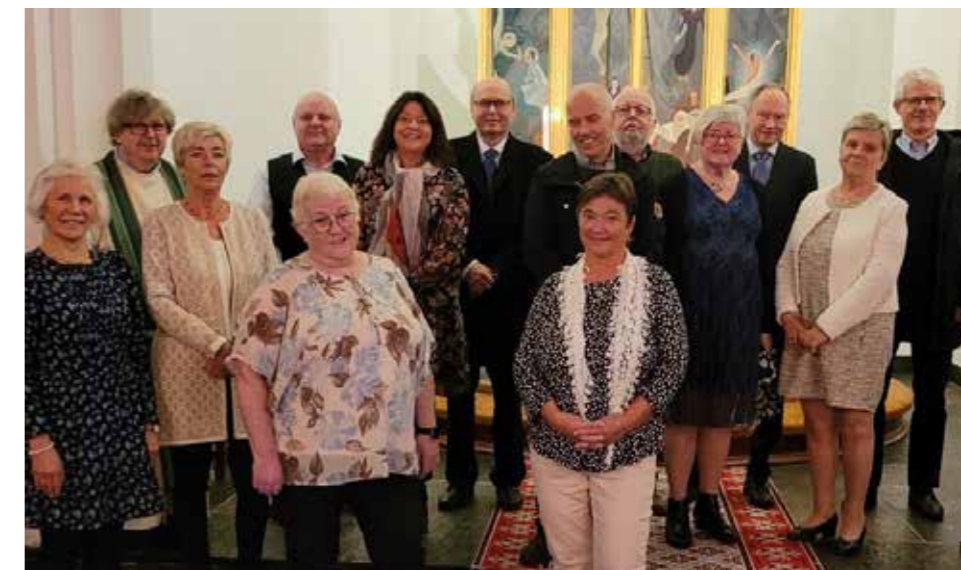
Vaksdal kyrkje 23. oktober: