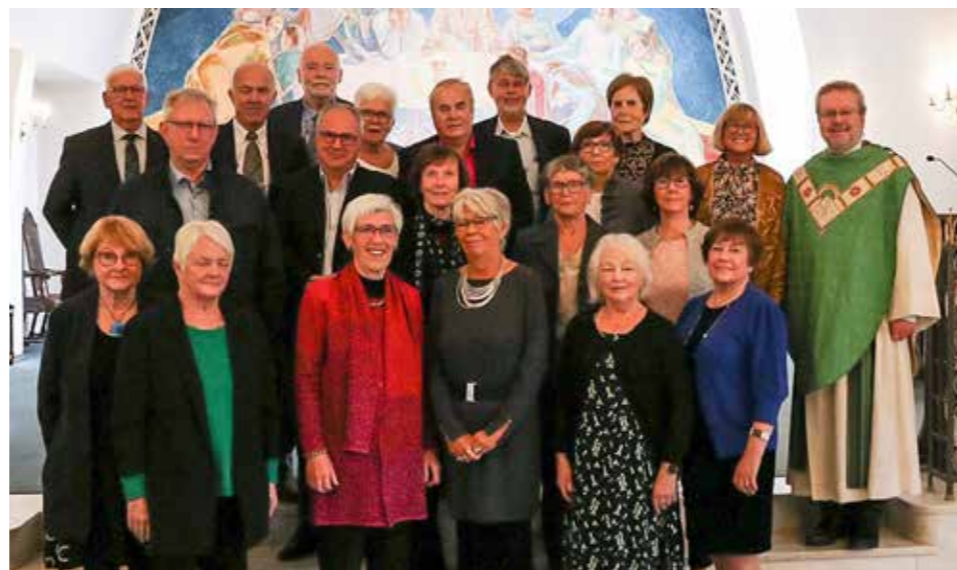
60-årskonfirmantar i Dale kyrkje 16. oktober

Namna på desse jublantane kom diverre ikkje fram i tide. Berre nyt bileta, så skal me freiste å få namna fram ved seinare høve.