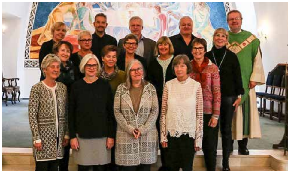
50-årskonfirmantar i Dale kyrkje 16. oktober:

I haust har det vore konfirmantjubiläum på Dale og Vaksdal. På Vaksdal vart for fyrste gong og 60-årskonfirmantane innbedne. På Stamnes vert det ikkje noko slik jubileum i år, men neste år.